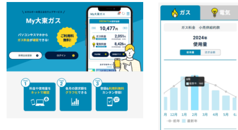
My 大東ガス画面イメージ